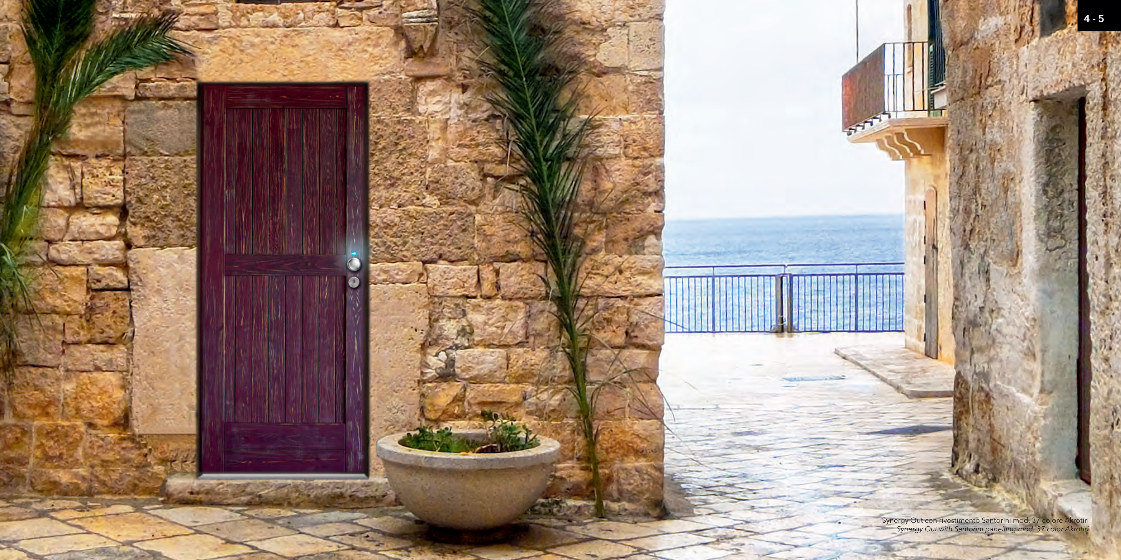
Synergy Out con rivestimento Santorini mod. 37 colore Akrotiri Synergy Out with Santorini panelling mod. 37 color Akrotiri