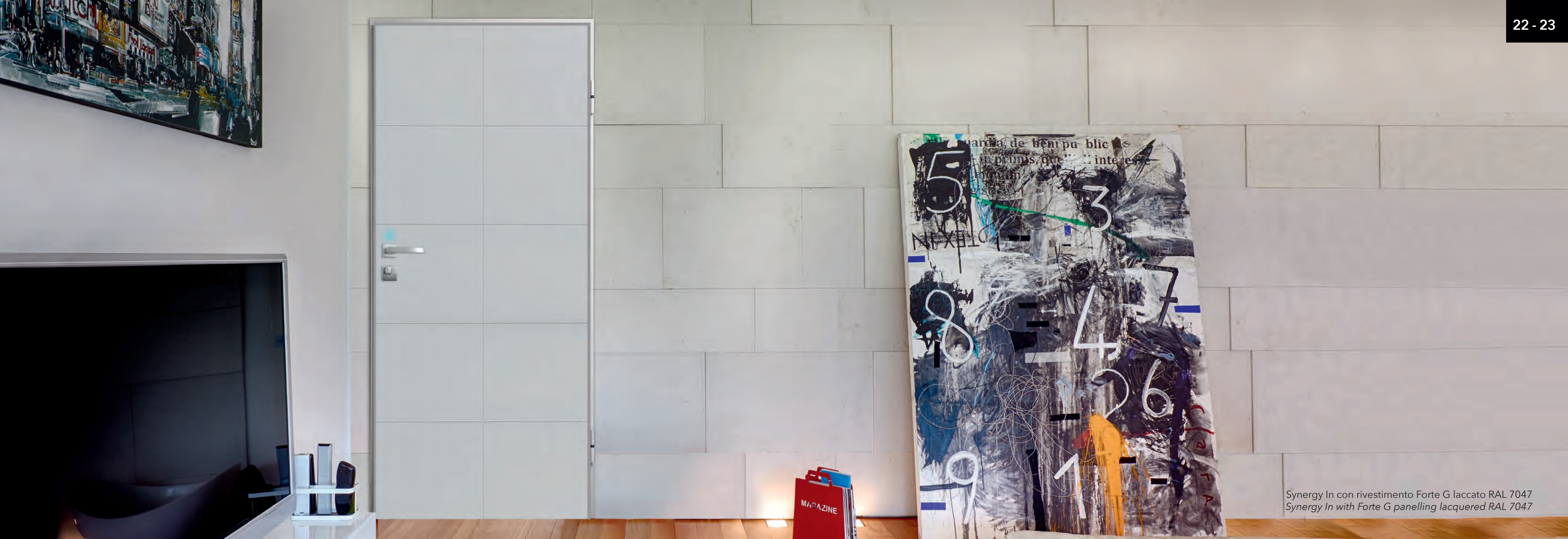
Synergy In con rivestimento Forte G laccato RAL 7047 Synergy In with Forte G panelling lacquered RAL 7047