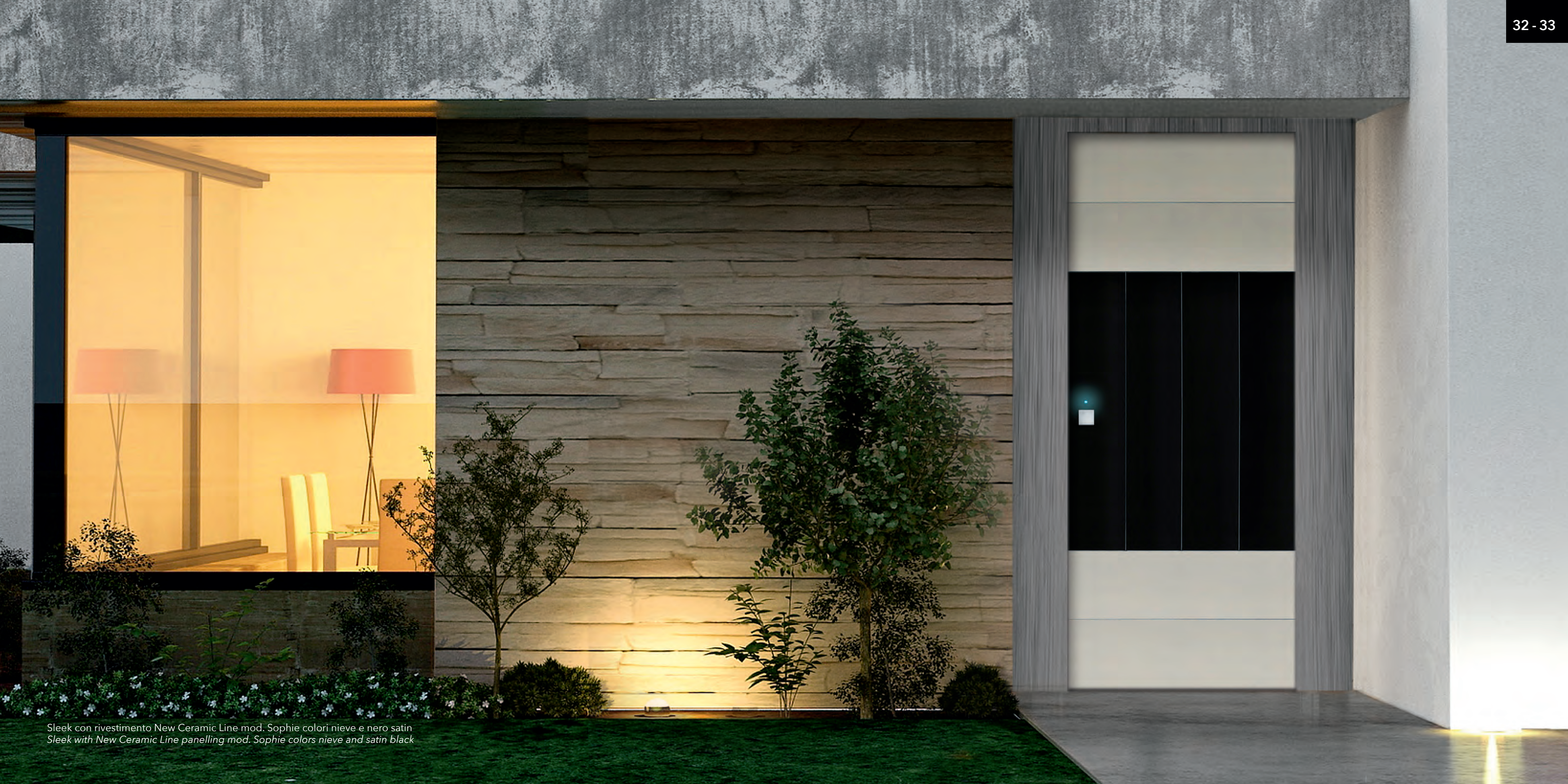
Sleek con rivestimento New Ceramic Line mod. Sophie colori neve e nero satin Sleek with New Ceramic Line panelling mod. Sophie colors nieve and satin black