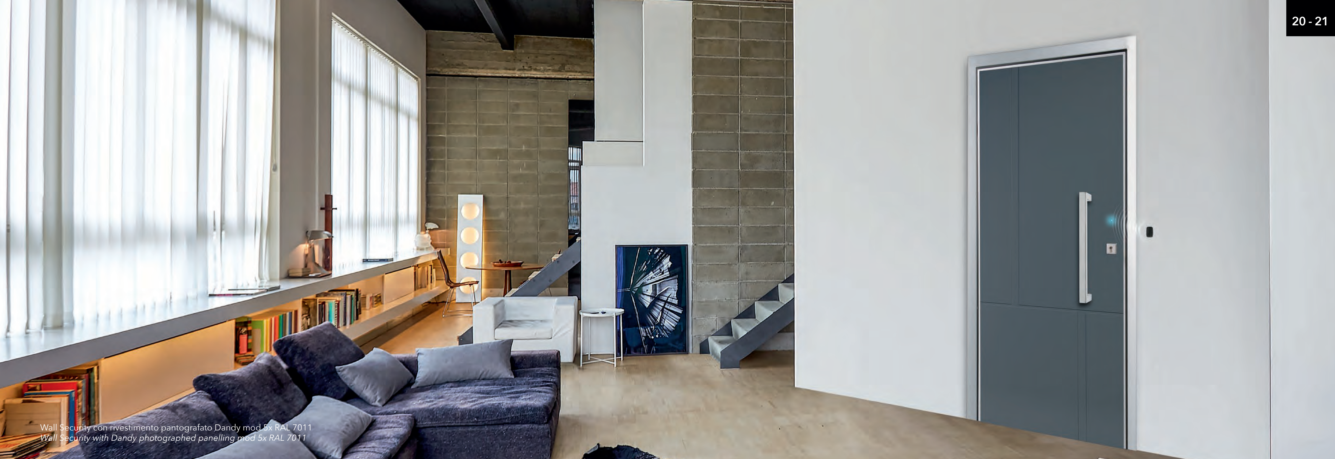
Wall Security con rivestimento pantografato Dandy mod 5x RAL 7011 Wall Security with Dandy photographed panelling mod 5x RAL 7011