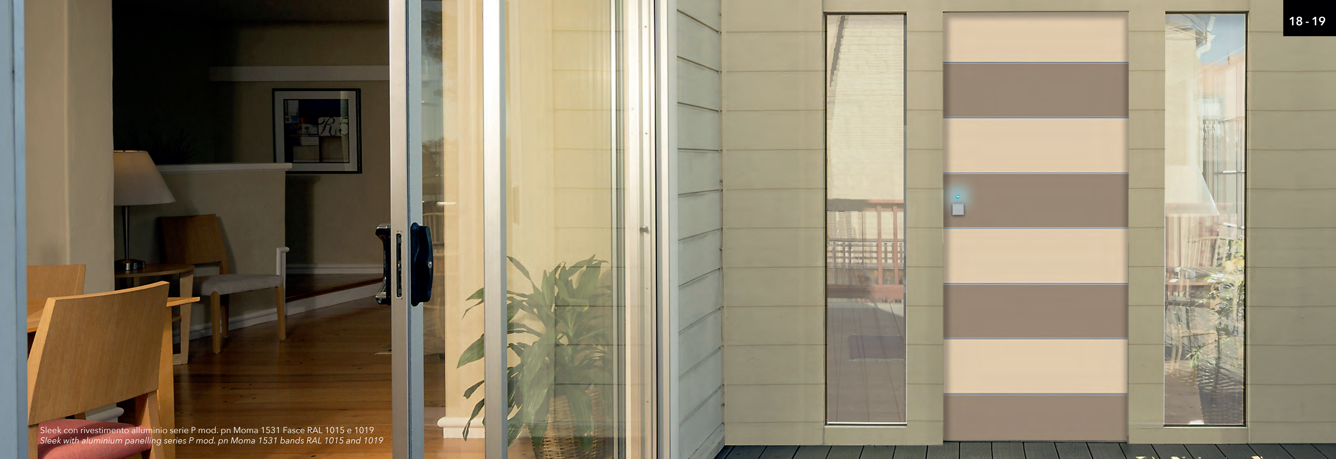
Sleek con rivestimento alluminio serie P mod. pn Moma 1531 Fasce RAL 1015 e 1019 Sleek with aluminium panelling series P mod. pn Moma 1531 bands RAL 1015 and 1019