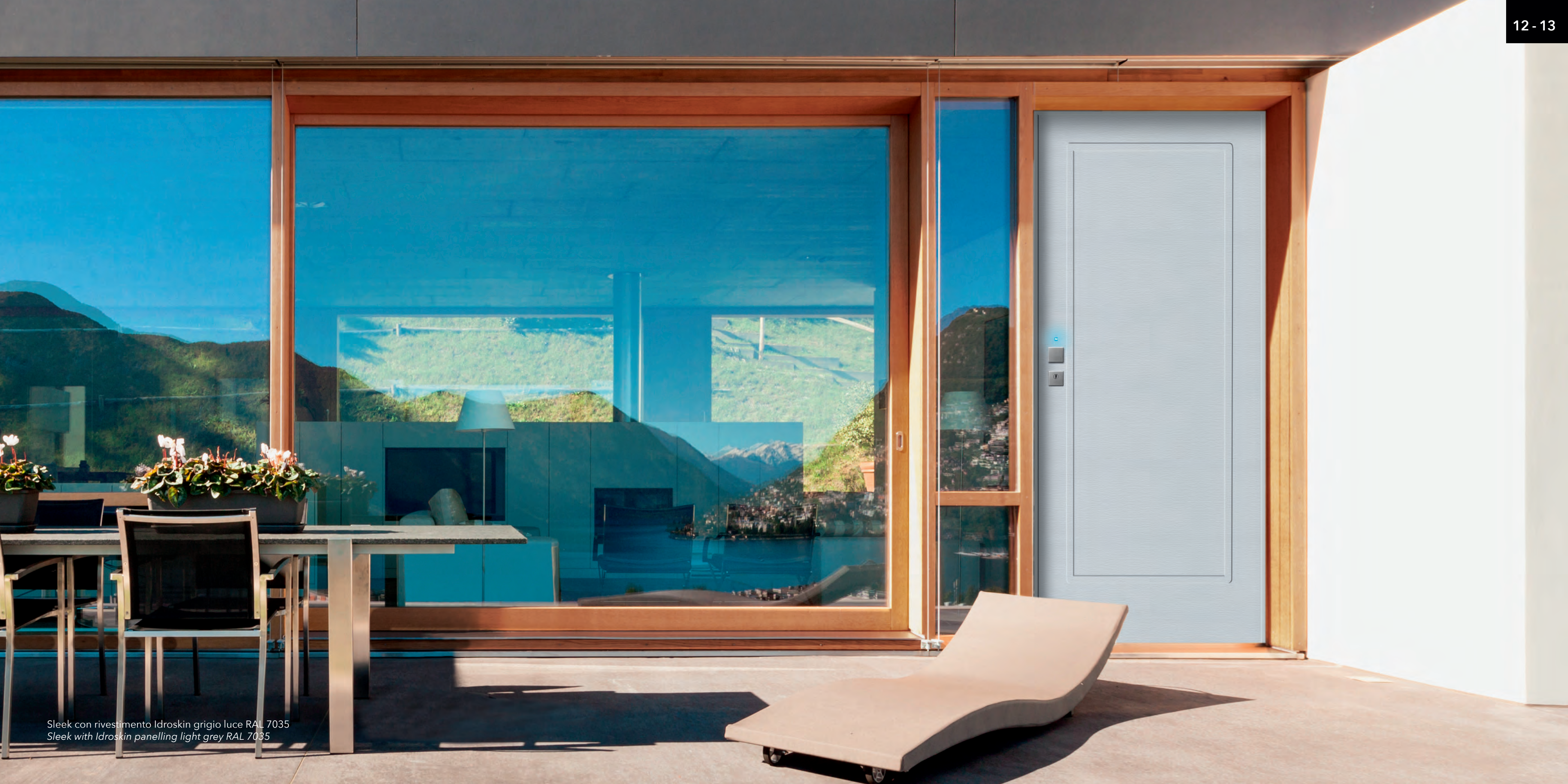
Sleek con rivestimento Idroskin grigio luce RAL 7035 Sleek with Idroskin panelling light grey RAL 7035