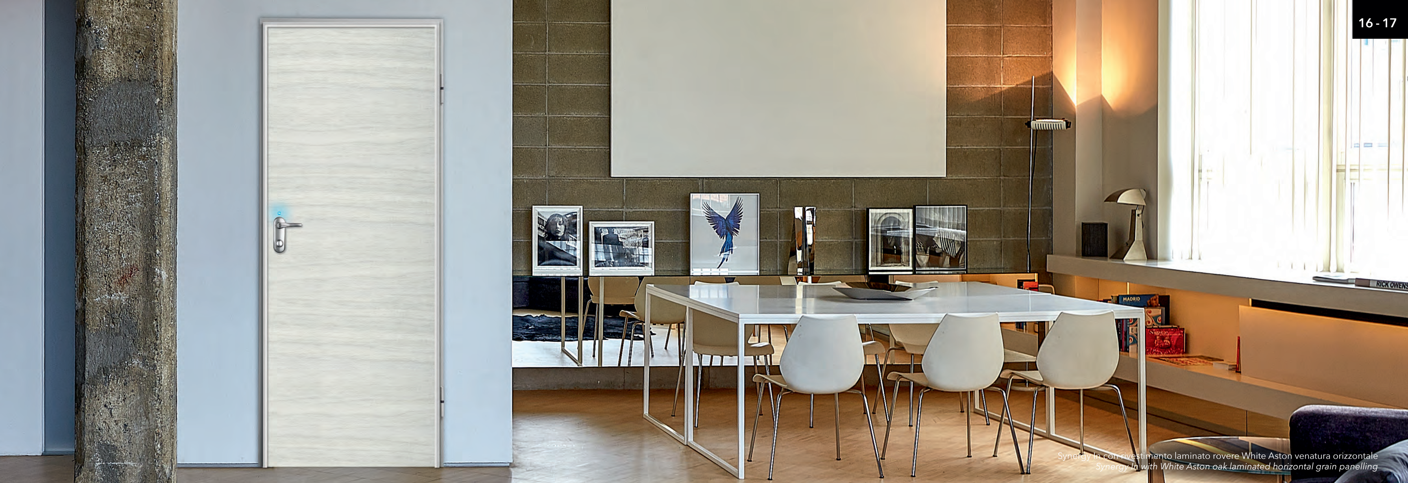
Synergy In con rivestimento laminato rovere White Aston venatura orizzontale Synergy In with White Aston-oak laminated horizontal grain panelling