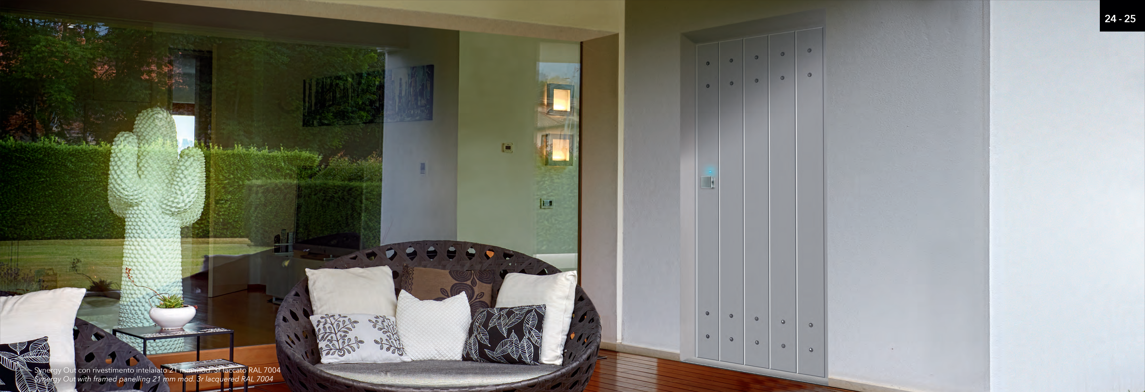
Synergy Out con rivestimento intelaiato 21 mm mod. 3r laccato RAL 7004 Synergy Out with framed panelling 21 mm mod. 3r lacquered RAL 7004